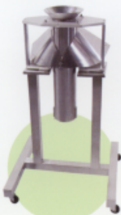
交換フォーマー及び移動台