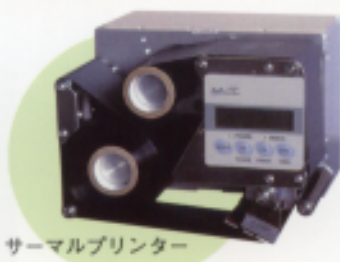
サーマルプリンター