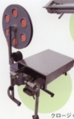
クロージャー結束機