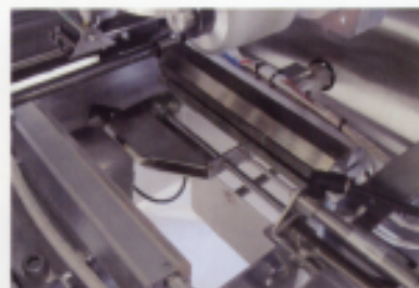
ガゼットきんちゃく